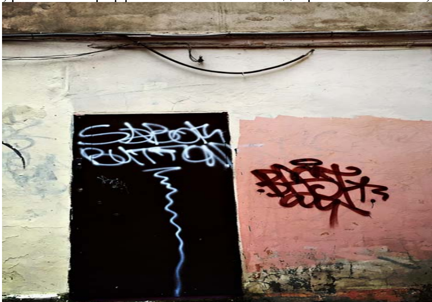
Рисунок 7. Надписи

Например, расписные граффити на стенах нашего дворика на Моховой, 26 (рис.7).