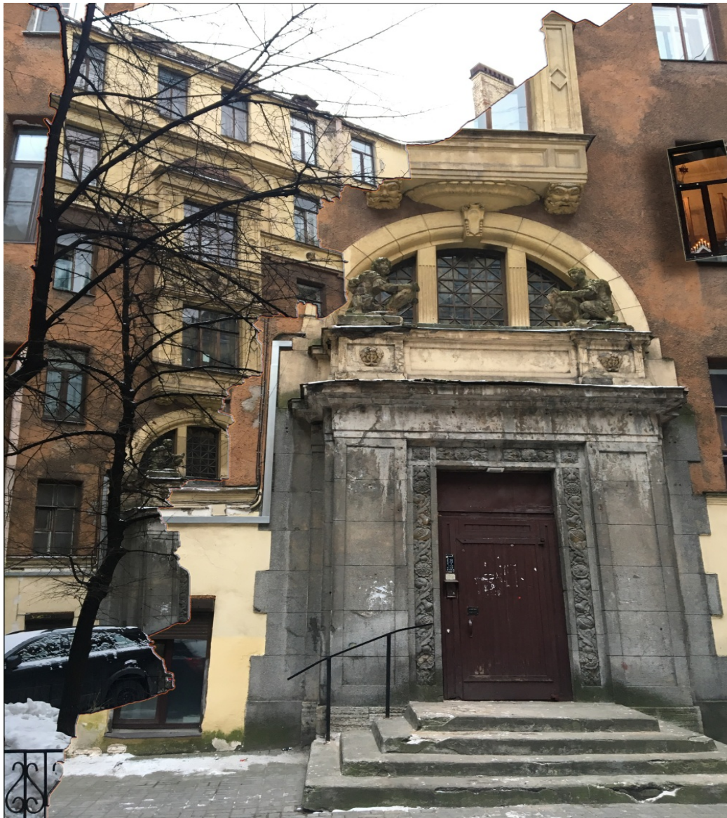
Рисунок 10. Загадочная дверь

никогда не канет в лету, ведь настоящие произведения мастеров неповторимы. Каждое здание, кирпичик, фонтан и ступенька сделаны как-то по особенному. Видно, что человек прочувствовал гармонию здания и места его построения, наконец, эпоху того времени (рис. 10).