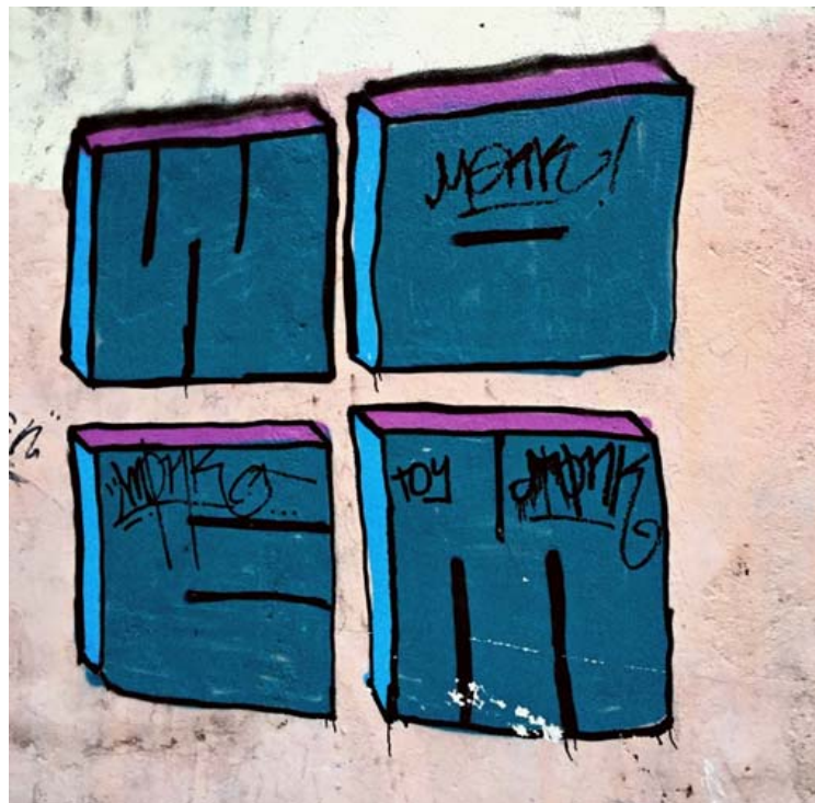
Рисунок 6. Граффити

Ведь, как ни крути, наше время всё же оставляет свои отпечатки на произведениях искусства