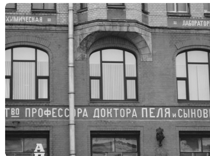
Рисунок 4. Фасад аптеки