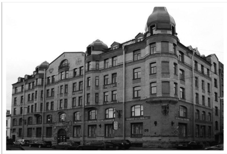
Рисунок 2. Здание аптеки

Башня Грифонов в «Квартале Аптекарей» на Васильевском острове - одно из удивительных мест Петербурга. Удивительность этого места заключается в его... неразгаданности. А неразгаданность придает ему мистический ореол, атмосферу пугающей таинственности, что создает почву для бесконечных домыслов и легенд.