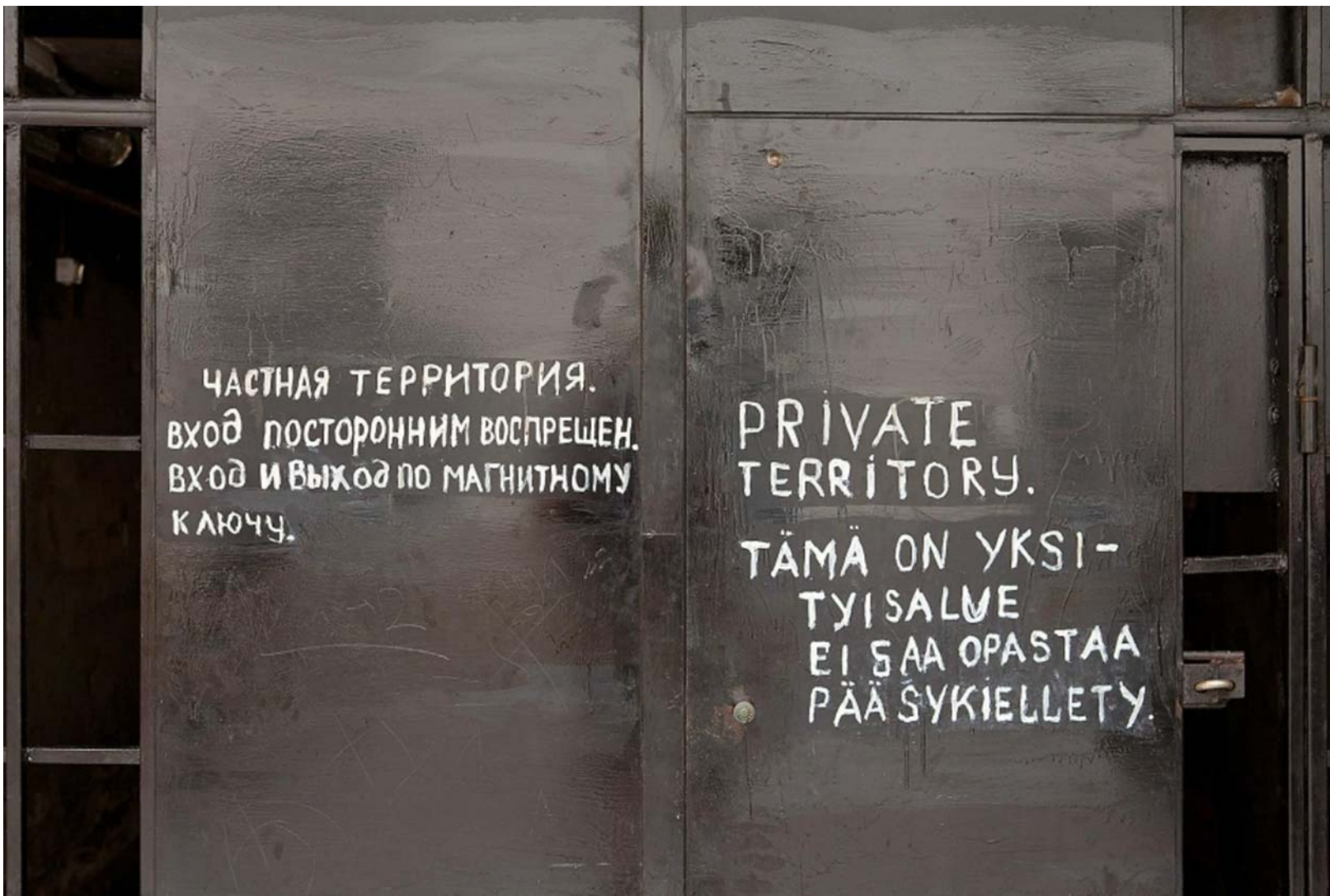
Рисунок 8. Надпись на воротах

На входе вас встретят вот такие ворота (рис. 8), поэтому увидеть двор вживую – это квест в реальности!