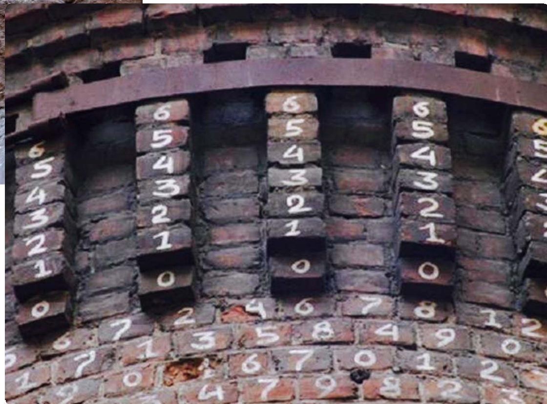
Рисунок 6. Цифры(слева крупно, справа на фасаде)