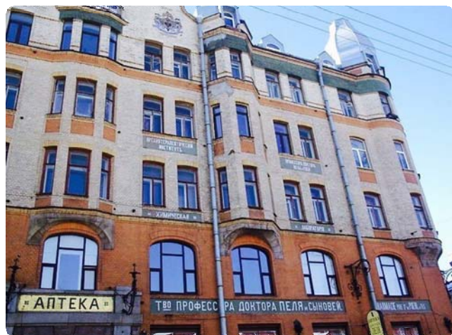
Рисунок 3. Аптека в солнечный день