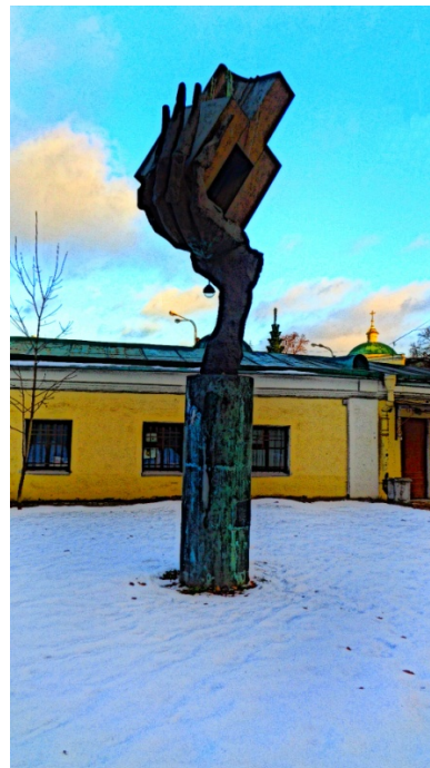
Рисунок 8. «Рука творца» - 2

На рисунке 8 «Рука творца», представлена с другого ракурса.