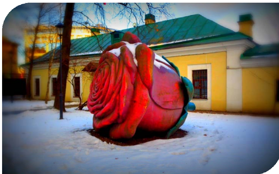
Рисунок 4. Роза Сергея Додта

Арт-объект просто лежит на земле. Его скульптор Сергей Додт, Германия (рис. 4).