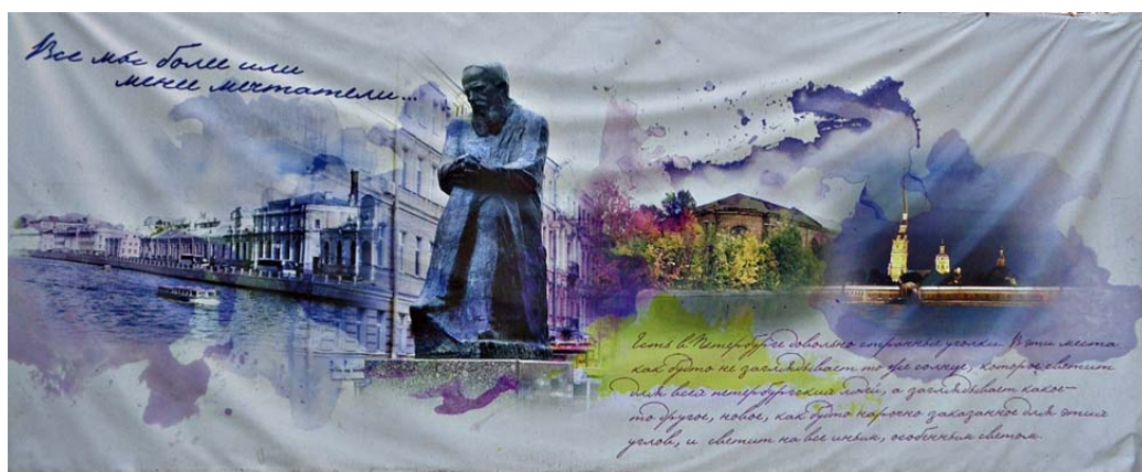
Рисунок 1. «Все мы более или менее мечтатели»

Музей существует с 1939 года как единственное в России музейное учреждение, занимающееся изучением, охраной и реставрацией памятников монументального искусства в открытой городской среде. Музей был основан обществом "Старый Петербург" для сохранения Лазаревского кладбища Александро-Невской Лавры, как музей-некрополь в 1939 году. На рисунке 1 показан главный слоган нового корпуса Государственного музея городской скульптуры Санкт-Петербурга.