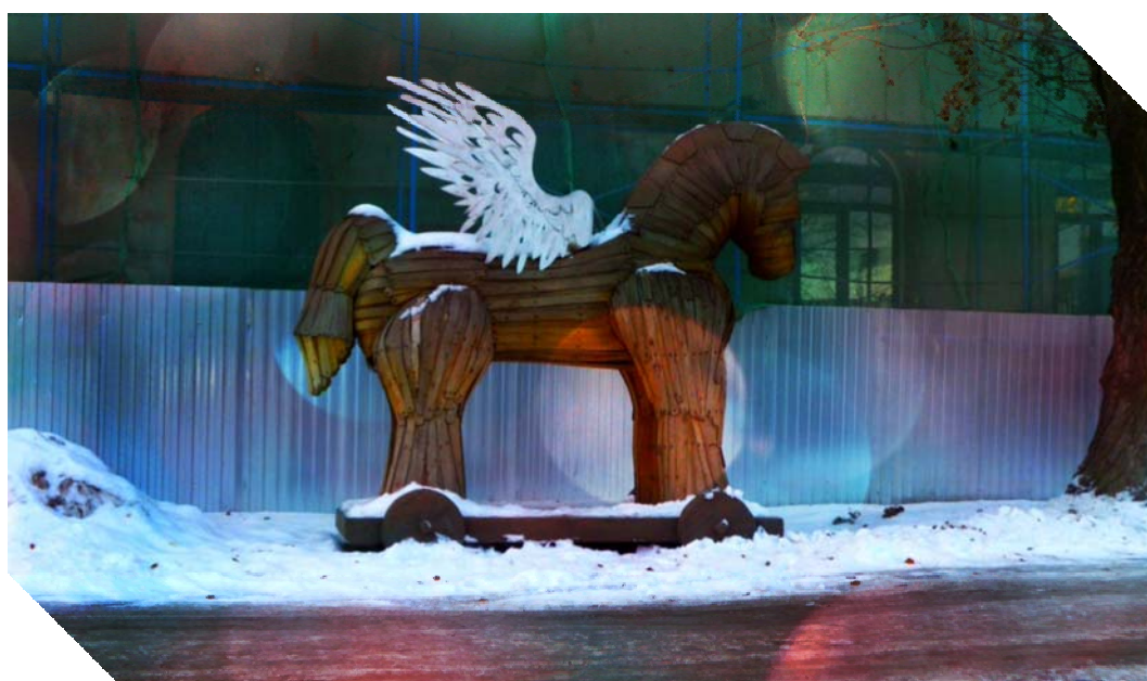
Рисунок 5. Работа Дмитрия Каминкера-1

Во дворе, помимо розы, есть еще много интересных арт-объектов. Выставка «Новые идеи для города - 2011» была посвящена в большей степени городской среде - во внутреннем дворике Музея городской скульптуры развернута экспозиция монументальных работ - «Крылатый морской конь. Из варяг в греки» Дмитрия Каминкера (Рис. 5, 6).