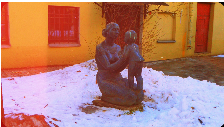
Рисунок 10. «Женщина с ребенком» - 2