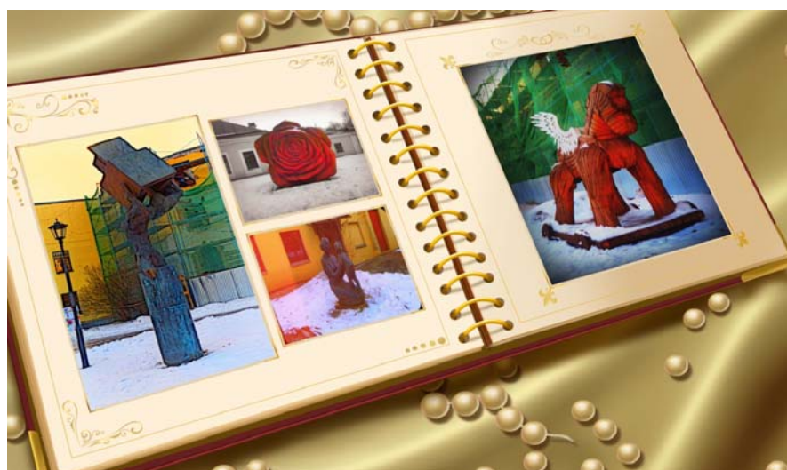
Рисунок 2. Коллаж некоторых экспозиций

В 2002 году открылся новый выставочный корпус музея, который расположен на Чернорецком переулке, сразу ставший известным в городе как площадка для интересных экспозиционных проектов. Его работа началась выставкой новых поступлений в музеи города из частных коллекций и антикварных галерей (рис. 2).