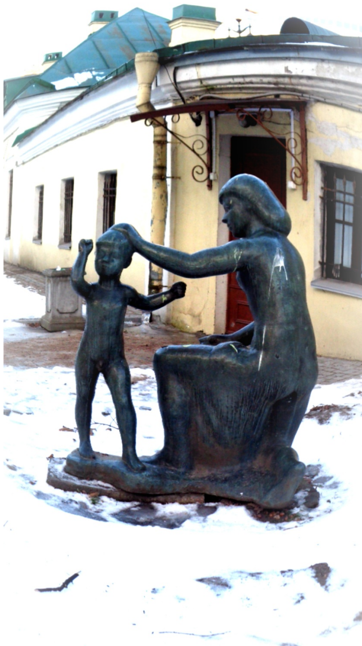
Рисунок 9. Женщина с ребенком

Также во дворе музея можно увидеть две безымянные скульптуры изображающие женщину с ребенком, которые прекрасно дополняют ландшафтный дизайн двора (рис. 9).