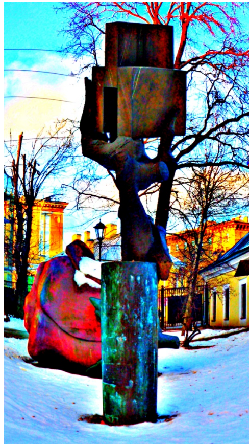
Рисунок 7. «Рука творца»

На рисунке 8 «Рука творца», представлена с другого ракурса.