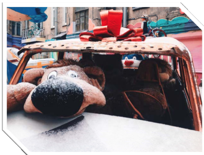
Рисунок 6. Водитель со стажем