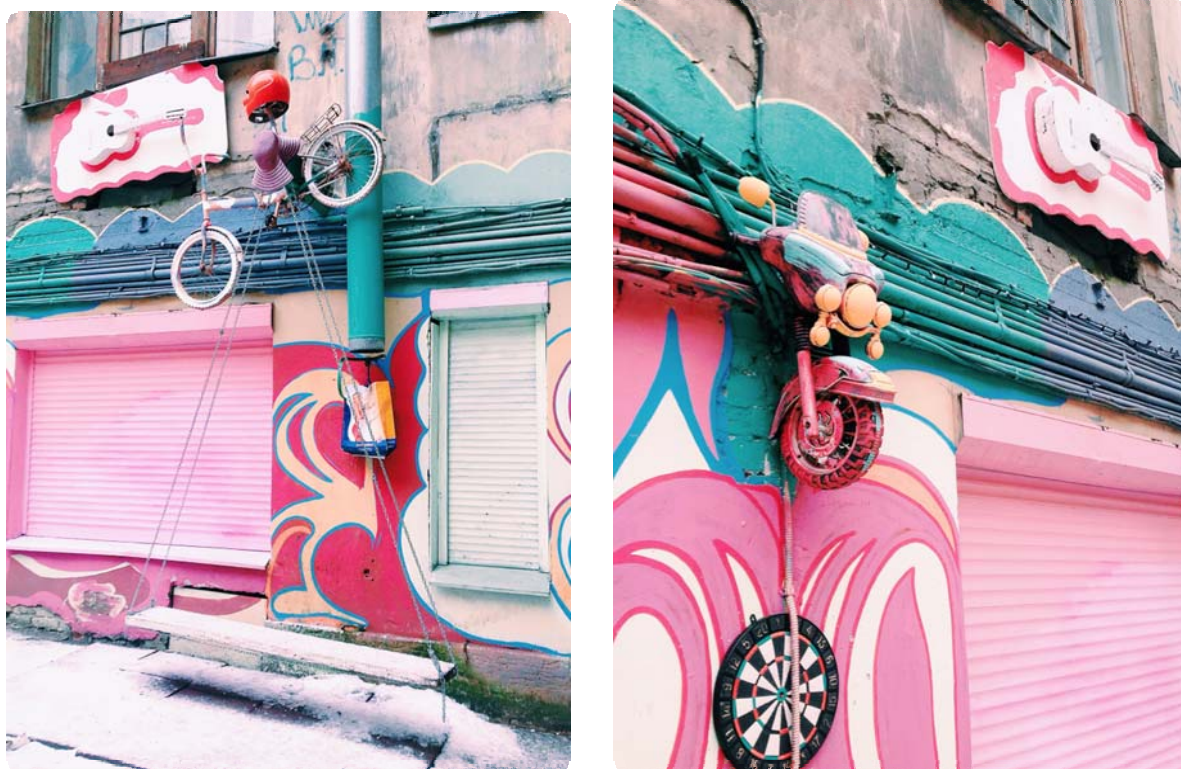
Рисунок 9. Летом дети могут довольствоваться качелями

И если это может больше понравится мальчишкам, то маленьким девочкам тут скорее придется по душе обилие розового цвета и необычные композиции из предметов с похожим оттенком (рисунок 9).