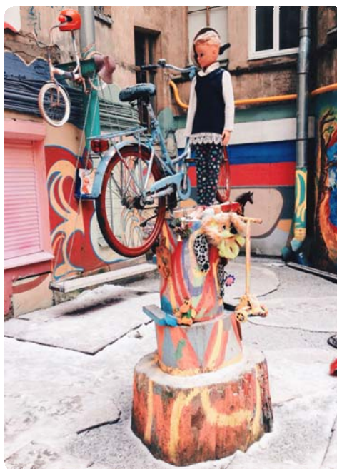
Рисунок 8. Летящие велосипеды