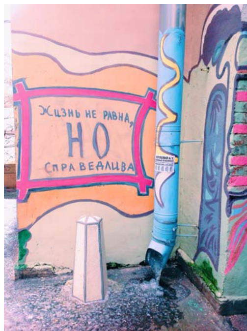
Рисунок 3. Немного о жизни