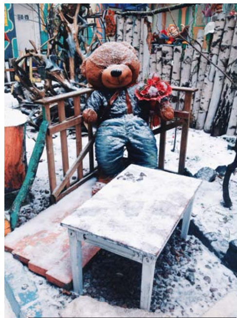
Рисунок 5. Косматые друзья всегда рады новым знакомствам