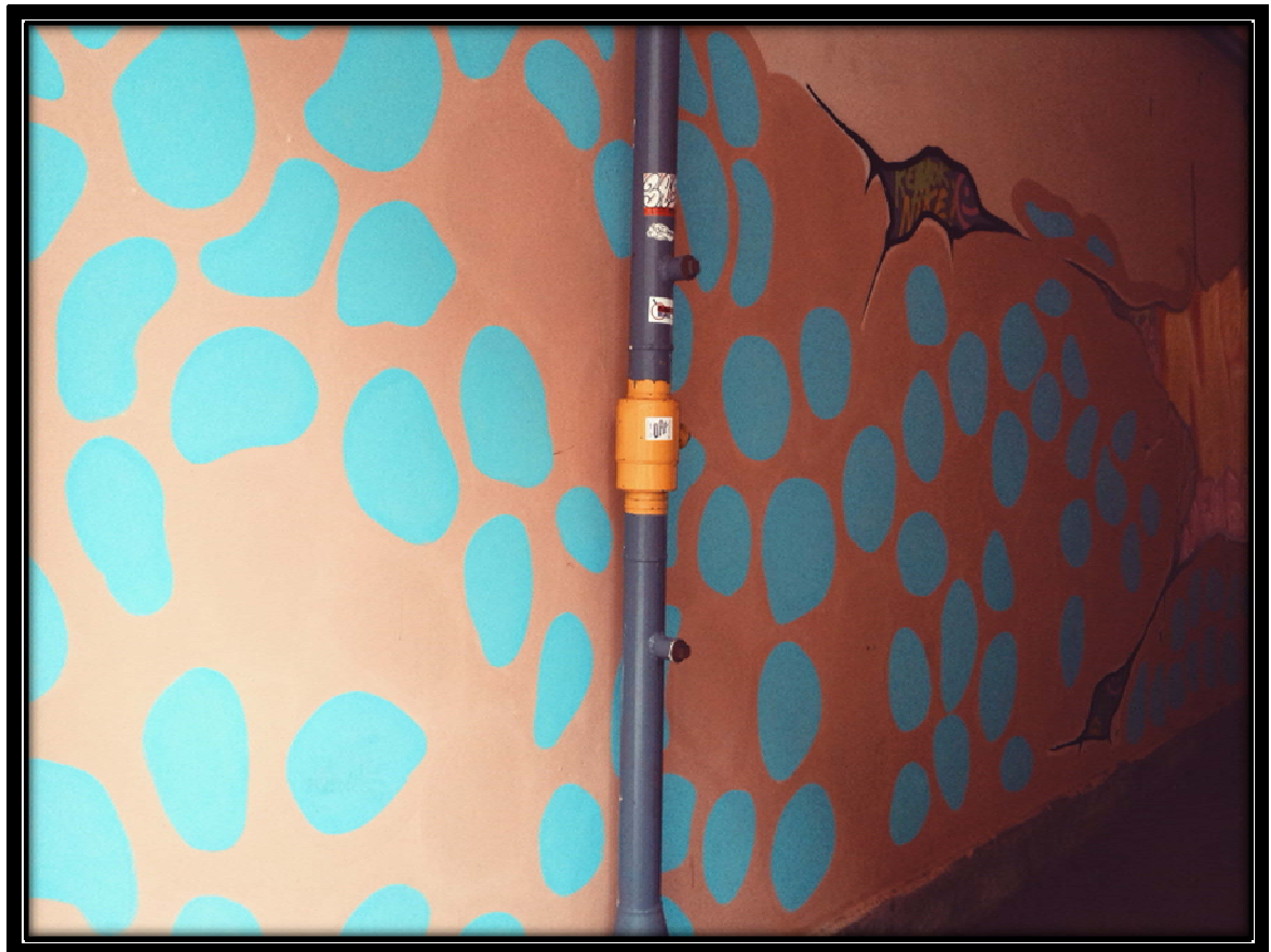
Рисунок 12. На пути во двор