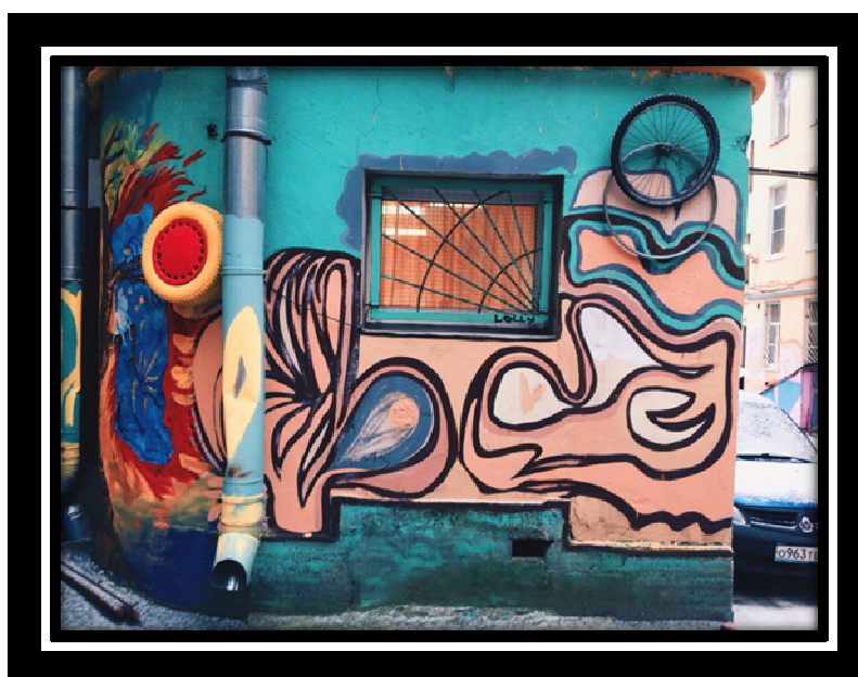
Рисунок 10. Даже стены излучают радость

Так, благодаря изобретательности и креативности одному человеку удалось создать атмосферу счастья и радости для всех жителей этого района и случайных прохожих.