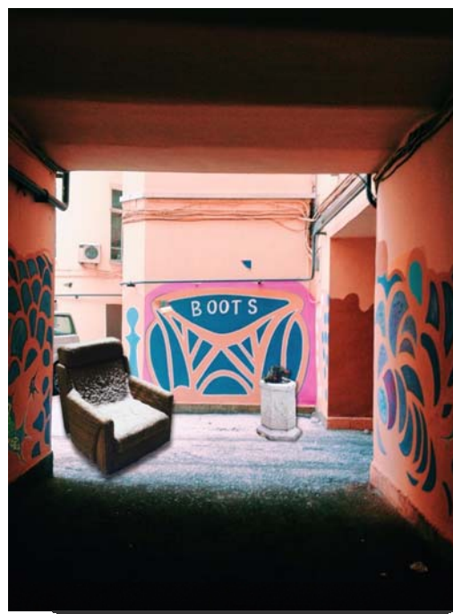
Рисунок 13. Коллажи

Теперь вы знаете, куда идти за хорошим настроением. В этом месте рады всем и всегда! А стоит только заглянуть в арку, как ваше лицо само начнет расплываться в искренне детской улыбке.