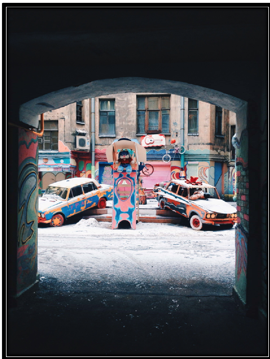
Рисунок 1. Главный вход во двор осуществляется через арку

Один из жителей дома на небольшой улице Полозова — Бард Нельсон — дал бой серой обыденности и создал во дворе уголок подлинного позитива и современного безумства. Ему удалось с помощью баллончика с краской, приложив фантазию и использовав ненужные вещи, создать единую картину — один из самых удивительных дворов Петербурга, вход в который представлен на рисунке 1.