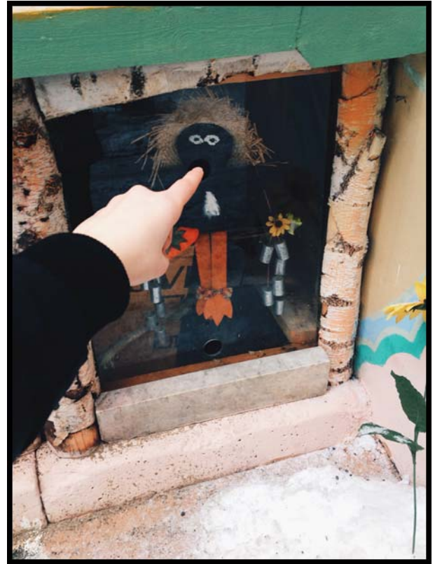
Рисунок 11. Общий вид и один из обитателей двора