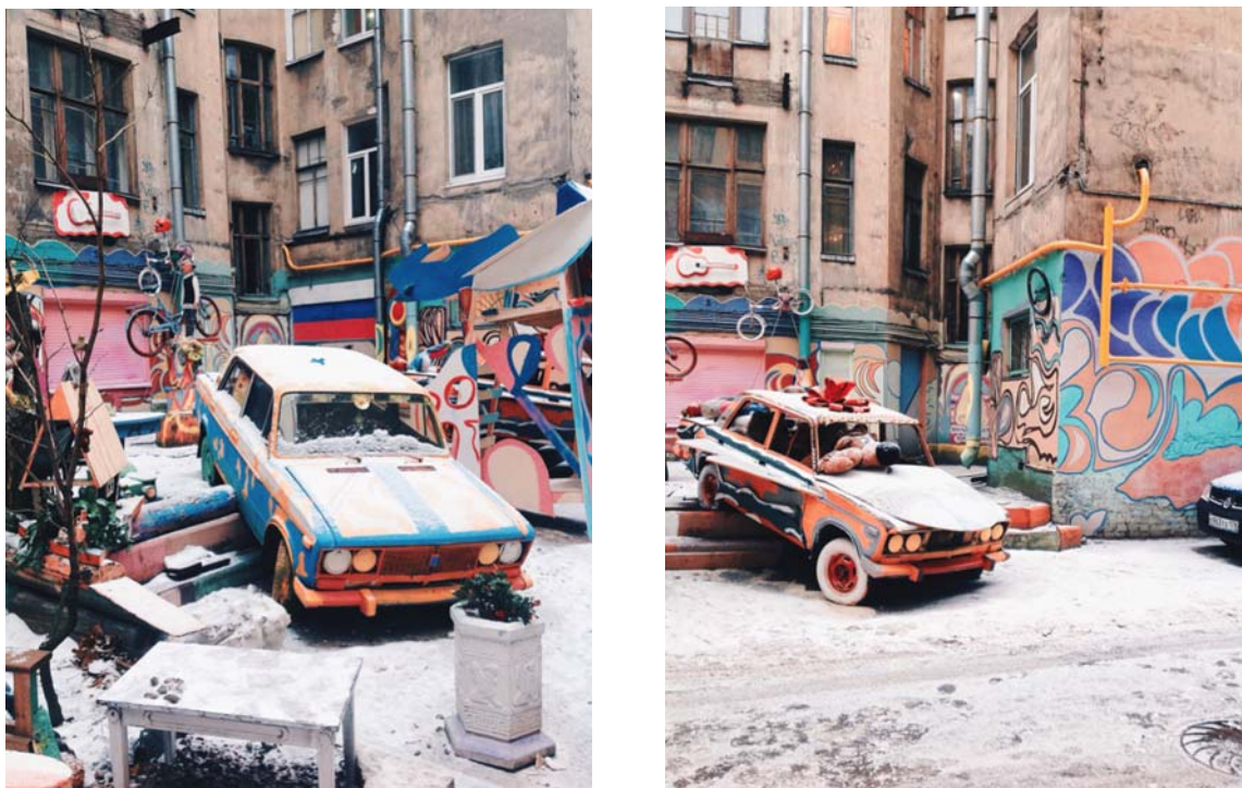
Рисунок 2. Правила парковки: метод плюшевых зверей

Нельсон – музыкант и художник, и результат его вдохновения не заставил себя долго ждать. Первый и центральный объект, появившийся во «Дворе Нельсона», — симметричная композиция из розовых и голубых «Жигулей». Преображение продукции автопрома вы можете увидеть на рисунке 2. Машины под струи краски подставил сам их владелец — сосед музыканта. Он был совсем не против преобразования своих авто, которые после покраски в яркие цвета и снабжения импровизированными тазиками-мигалками художник водрузил на своеобразный пьедестал.