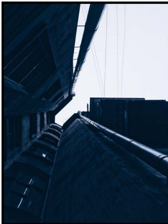
Рисунок 7. Стоит только поднять голову

Только вот верхняя часть дома так не пестрит хорошим настроением: здание покрыто старой выцветшей краской и мало чем привлекает взгляд, что можно увидеть на рисунке 7.