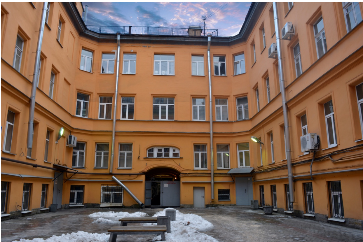
Рисунок 3 – Наш дворик

Ну что? Заходим внутрь? Добро пожаловать!