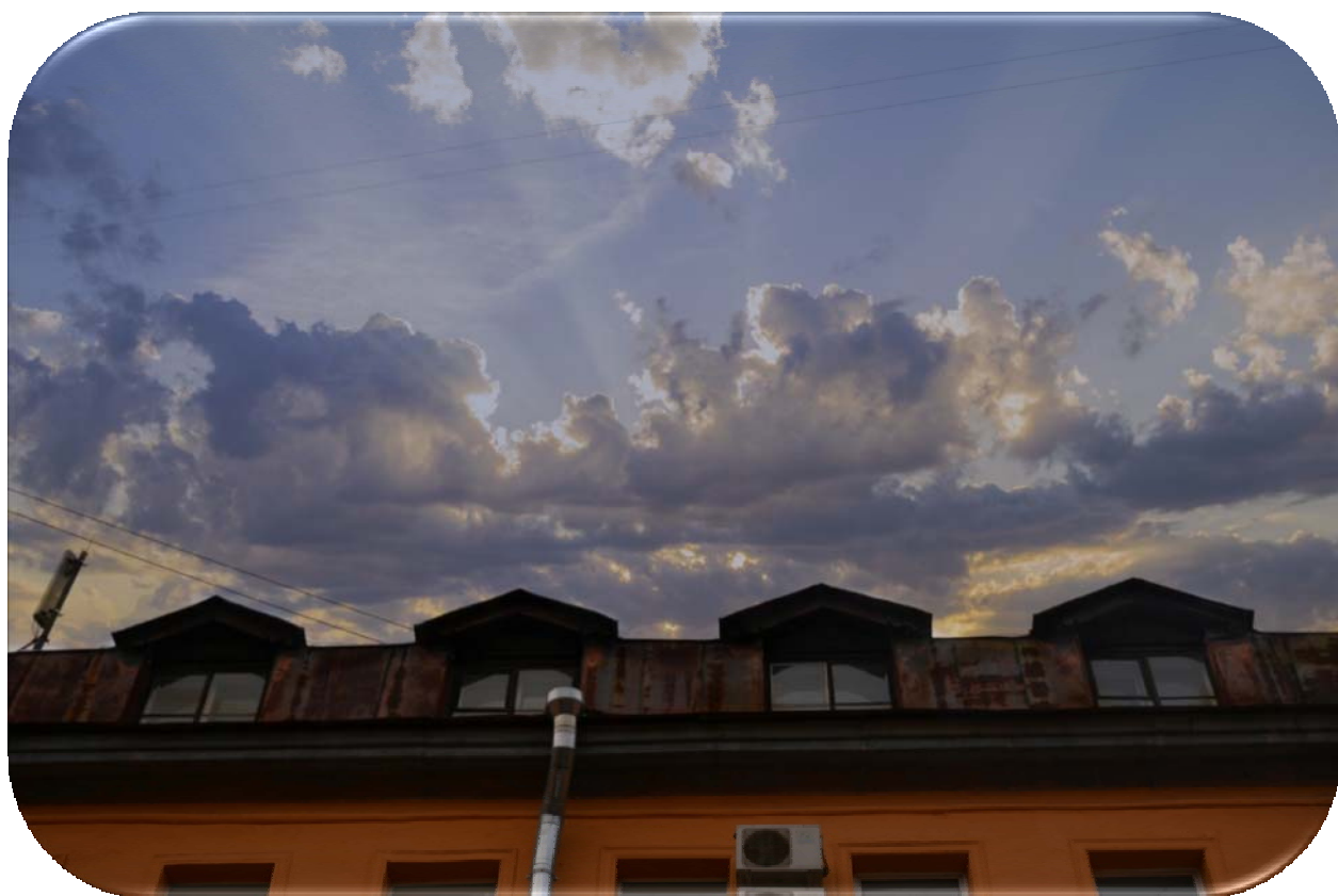
Рисунок 1 - Питерское небо

Стоить поднять взгляд и можно увидеть это замечательное питерское небо над нами и верхние этажи родного института (рис.1).