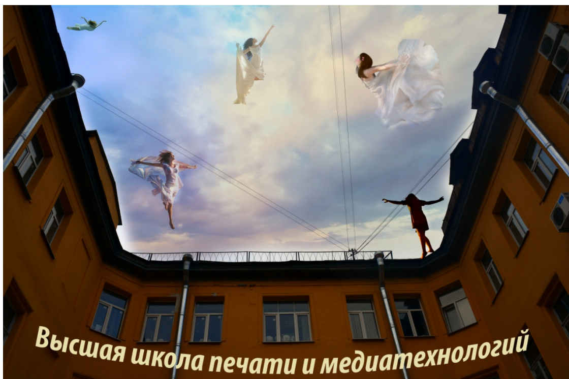
Рисунок 4 - Музы над нами