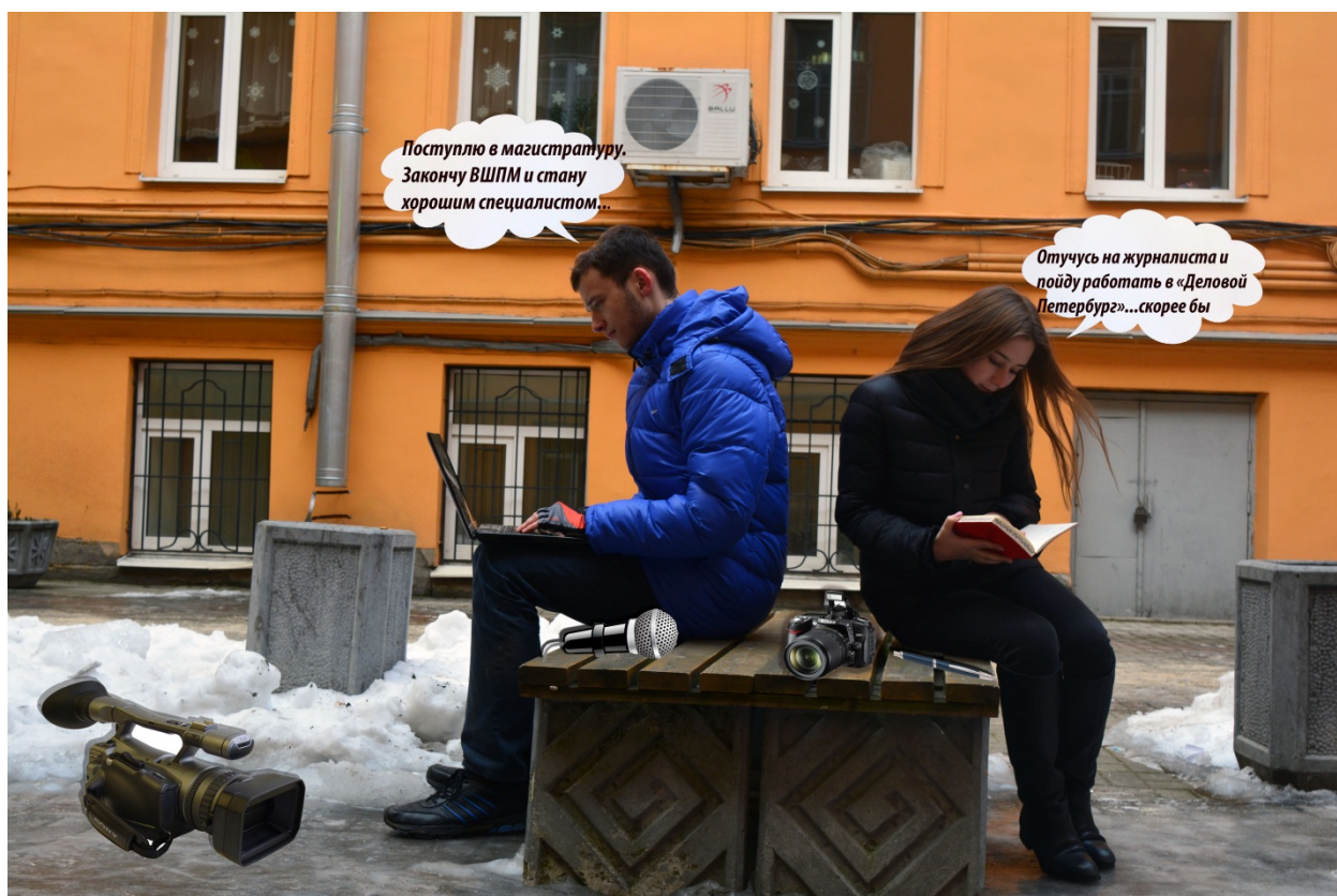
Рисунок 10 - Студенты во дворе

Вперёд, в успешное будущее! Это наш девиз. Мы пока еще только собираемся стать успешными журналистами. Наши мысли путаются, мы выбираем направления – радио, телевидение, печать. А может кто-то станет монтажёром, оператором или фотографом? Впереди у нас еще как минимум 2,5 года учебы. А пока мы только мечтаем, окруженные стенами института (рис.10).