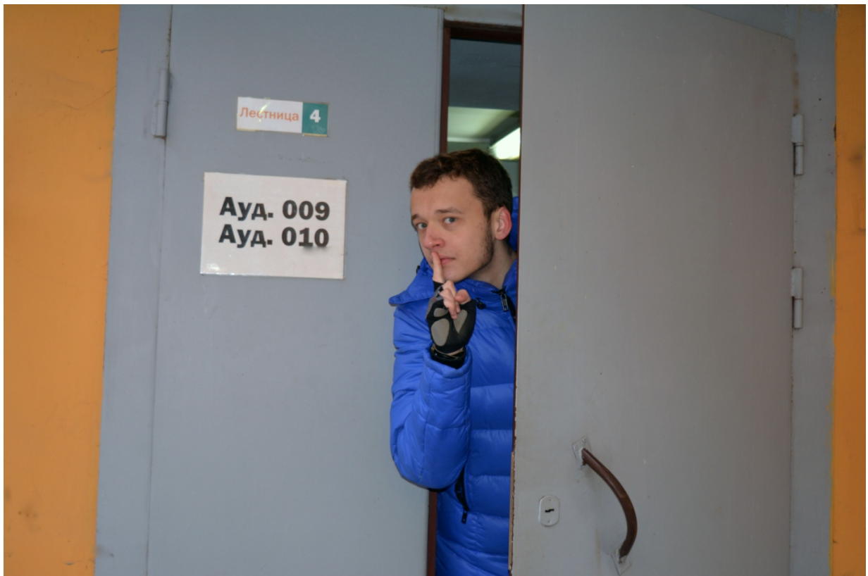
Рисунок 9 - Секрет

Мы открыли вам тайну. Убедительно просим - никому не рассказывайте об этом (рис. 9).