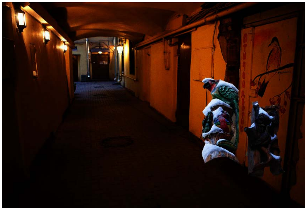
Рисунок 5. Вход в арку