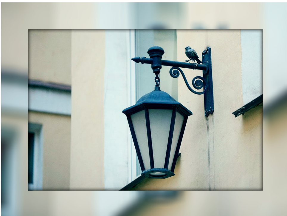
Рисунок 6. Фонарь

«Птичий дворик» — плод совместных усилий Романа Зайцева и его друзей – скульпторов. (рис. 6 и рис. 7) Одно из них представил в окне. Курьез ситуации заключался в передаче со второго этажа на землю визитки, скрепленной с конфетой.