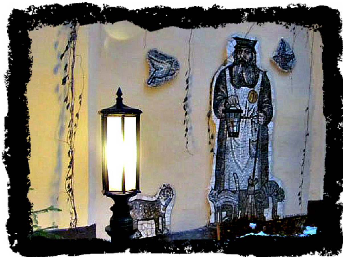
Рисунок 3. Ночная охрана

Также в «Птичьем Дворике» висит Гимн Петербургскому Двору. Здесь всегда чистота, уют, разбит чудесный цветник. (рис.3)