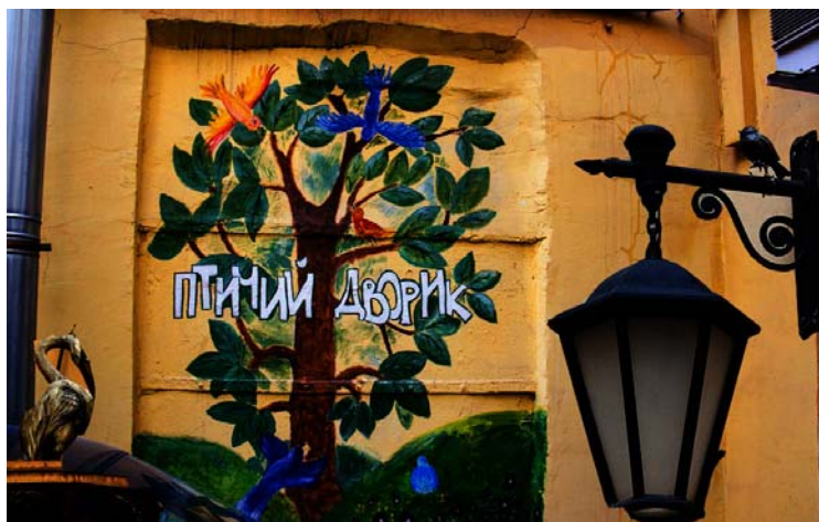
Рисунок 8. Птичий дворик 2

Рассказать о тематических дворах, когда благоустройство крутится вокруг какой-то идеи. Информационным поводом стало пополнение коллекции скульптур в «Птичьем дворике». (рис. 8)