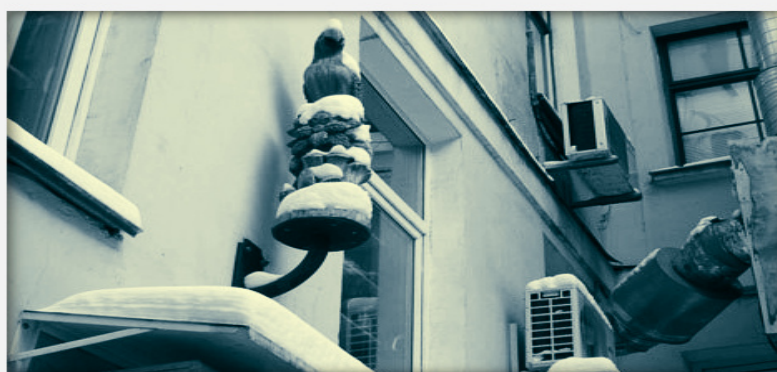
Рисунок 7. Панорама из окон