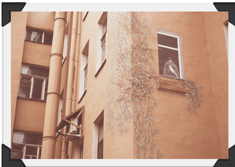
Рисунок 4. Фасад жилого здания

При создании «Птичьего дворика» не использовано ни одной копейки бюджетных средств, это плод совместных усилий Романа Зайцева и его друзей-соратников – ландшафтников, скульпторов, художников. (рис.5)