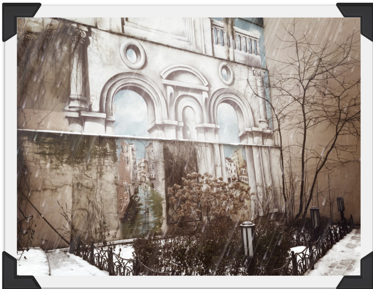
РИСУНОК 4. ВЕСНА

На граффити легко узнать виды Рима и Венеции. Красота и лоск, наведенные в одном отдельно взятом дворе, не были согласованы с чиновниками, которые в ответ хотели закрасить все стены в типовой бежевый цвет. Благодаря вмешательству неравнодушных жильцов дома и активистов расписанный двор удалось отстоять. Кстати, теперь проход в дневное время всегда открыт, магнит у калитки ворот включают ближе к вечеру. Когда не хватает денег на билет до Италии, купить жетон на метро и очутиться в прекрасном месте с видом на римский Колизей и венецианские каналы (рис. 4)