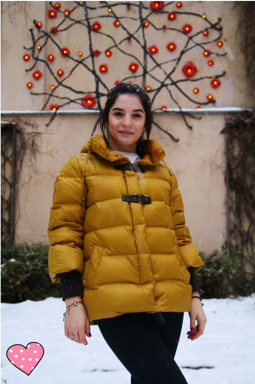
РИСУНОК 8. Я

Я надеюсь, что выбрала достойное место для творческого задания. Надеюсь в своем небольшом рассказе, я объяснила, всю историю этого потрясающего двора. Спасибо за внимание! До свидания!