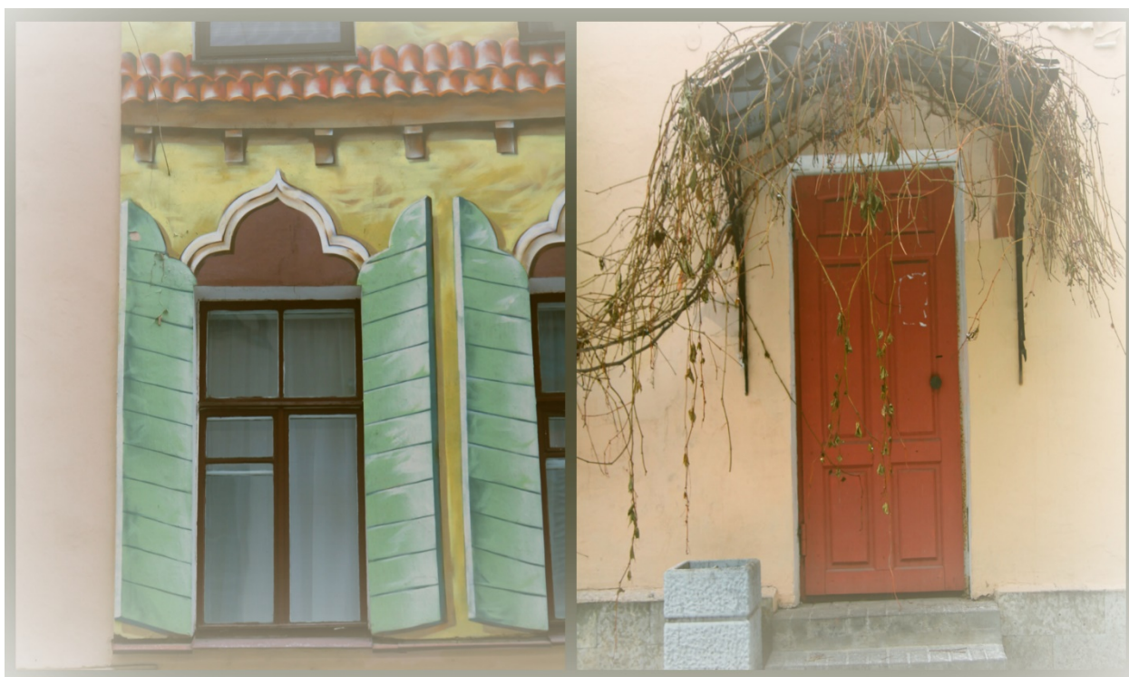
РИСУНОК 5. КОЛЛАЖ 1

Роспись во дворе на Итальянской, 29 все-таки удалось отстоять. Возмущенные горожане завалили КГА обращениями с просьбой согласовать художественные работы "задним числом". В результате закраску стен приостановили, по словам Анастасии Веселовой, власти договорились с художниками, что те предоставят свои эскизы для согласования. Затем они восстановят уничтоженные росписи и оформят двор согласно первоначальному проекту