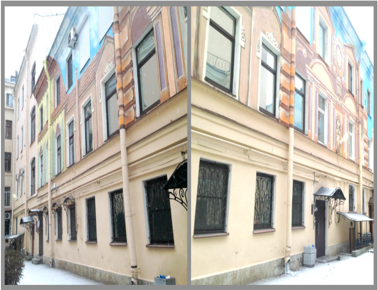
РИСУНОК 6. АРТ ЗДАНИЕ

Оказаться в центре Италии в Санкт-Петербурге, это ли не чудо? Заходя во дворик захватывает дух. Я была здесь зимой, но представляю какая здесь красота летом. Даже несмотря на мороз, я провела долгое время в этом невероятном месте. Я решила, что все мои гости, которые будут посещать мой город, обязательно должны будут увидеть это произведение искусства. Очень жаль, что власти не дали возможности доделать эту работу. Таких закоулков как в Санкт-Петербурге нет ни в одном городе страны. Летом бродить по ним одно удовольствие. называется, ни один двор Санкт-Петербурга не похож на другой. Есть дома, которые соединяют галереи, идеально круглые дворы... Внутри улицы Рубинштейна — готические своды, на итальянской улице — итальянский дворик.