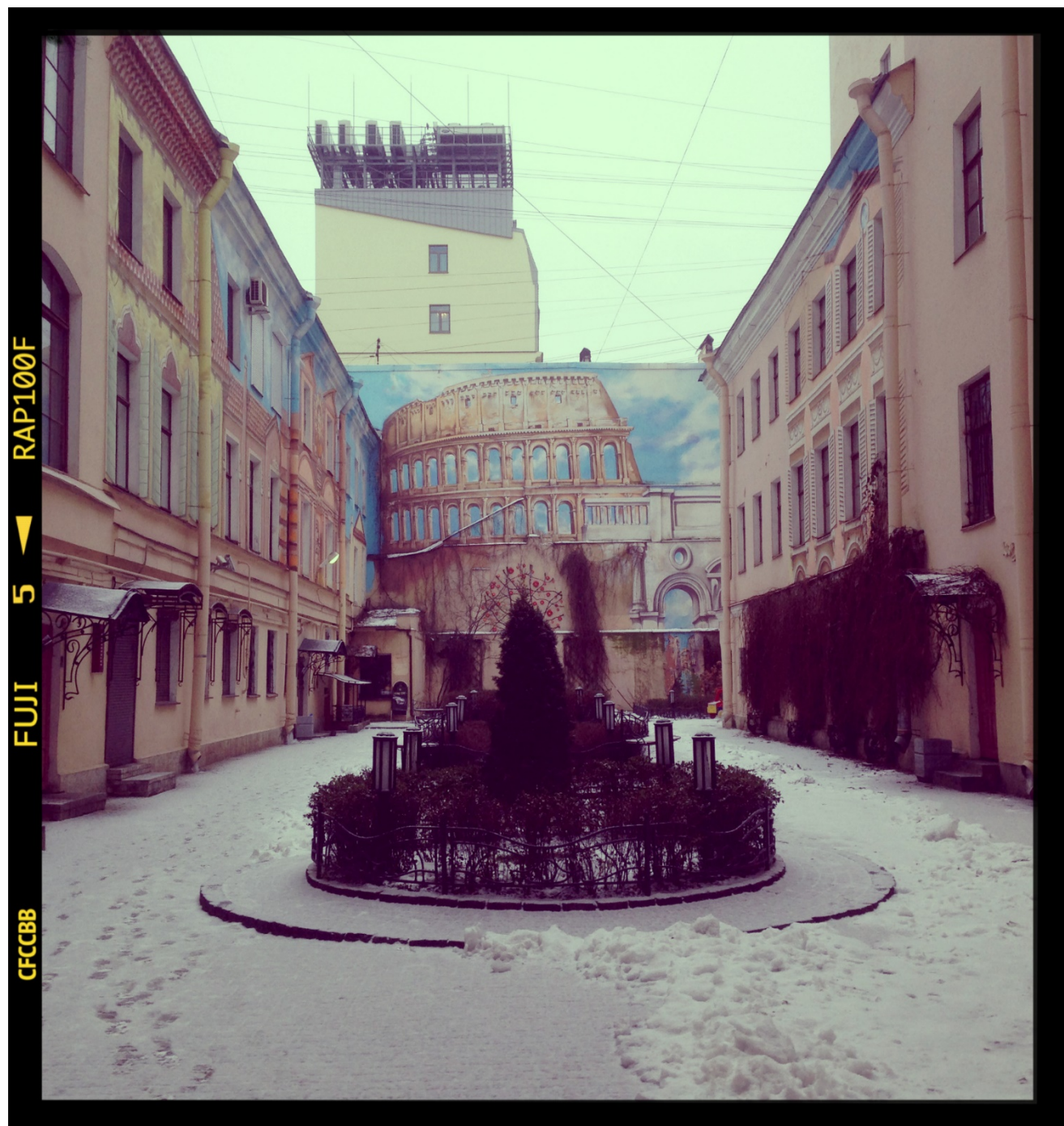
Рис.1 Вид двора при входе

Самый красивый двор Санкт-Петербурга расположился в сердце города на Итальянской улице.