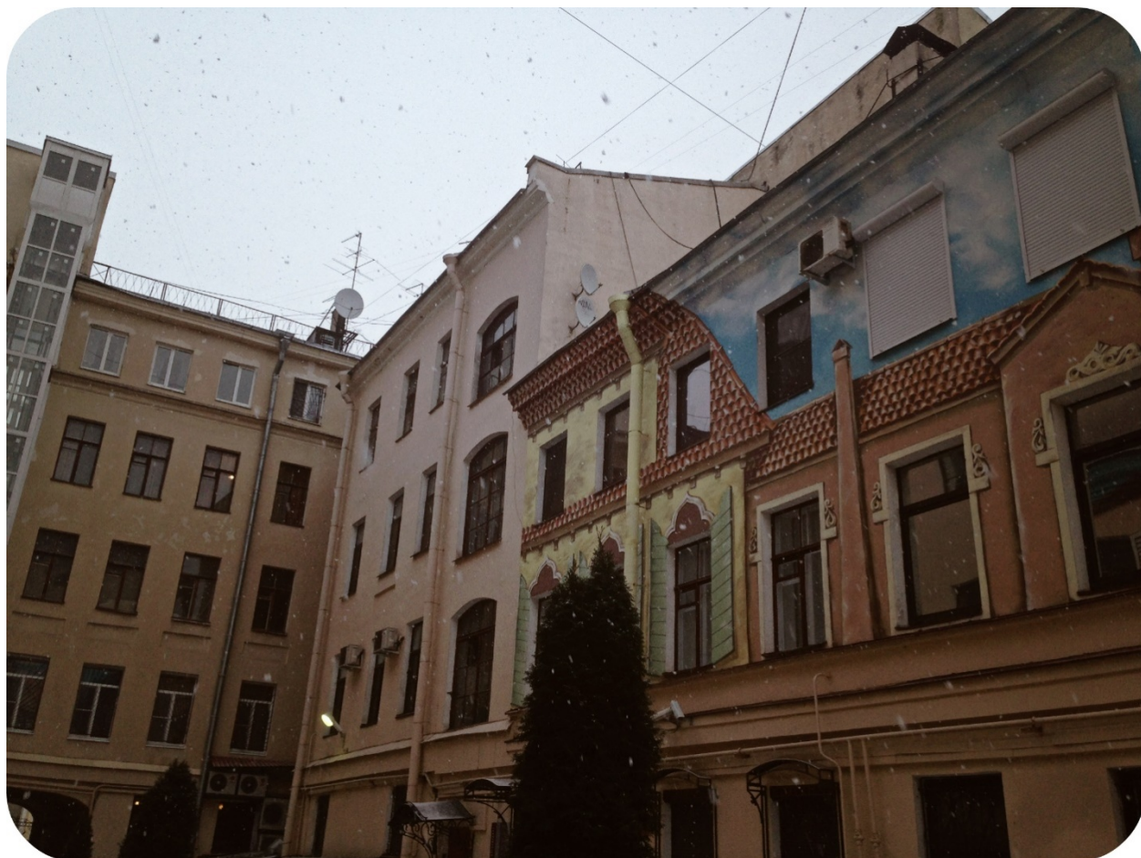
РИСУНОК 2. СНЕГОПАД

Затем около месяца работы, как по художественной росписи двора, так и по устранению рисунка, были приостановлены для согласования с профильным комитетом. После того, как необходимые согласования были получены, художники продолжили свою работу, на сегодняшний день роспись двора закончена (рис. 2)