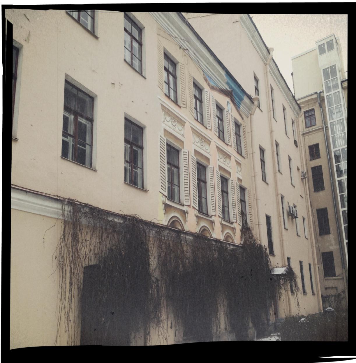
РИСУНОК 3. ЖИЛОЙ ДВОР

Мечта попасть в Рим осуществится за считанные минуты, если на Итальянской улице Петербурга свернуть во двор дома № 29. Правда, сначала придется дождаться, пока ворота во двор откроют его жильцы или работники находящихся внутри офисов. Зато потом перед взором посетителей открывается частичка солнечной Италии с изображением Колизея на центральной стене, знаменитых венецианских каналов, переулков. Окна соседних домов приобрели нарисованные открытые ставни, под стеной с Колизеем разбит палисадник, а вверх по ней тянется настоящий плющ. Декоративное апельсиновое дерево и небольшой фонтан усиливают эффект присутствия в Италии. Посетителей дворика также заинтересует находящаяся поблизости детская площадка. Стоит отметить, что стены двора были расписаны по заказу жильцов. Их пример показывает, как легко наполнить окружение яркими красками на радость себе и людям (рис. 3).